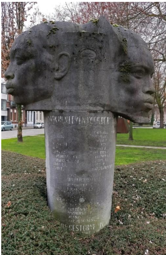
Het oude monument eert 'Mechelse pioniers'.