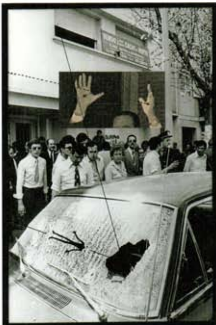
Eduardo Molinari Día de los muertos (Day of the Death) , from the series El cuchillo (The Knife) , 2000 Photograph from the Archivo General de la Nación Argentina (Argentina's National General Archive). Courtesy the artist

Tracés Tracings. Een kunstproject van Bie Michels An art project by Bie Michels , redactie Hugo Durieux, maart 2012, 96 p. ISBN 978-94-6190-817-9, taal Nederlands / Engels. Prijs €10,00